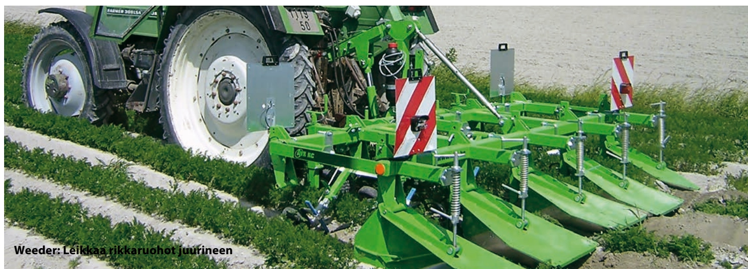
Weeder: Leikkaa rikkaruohot juurineen