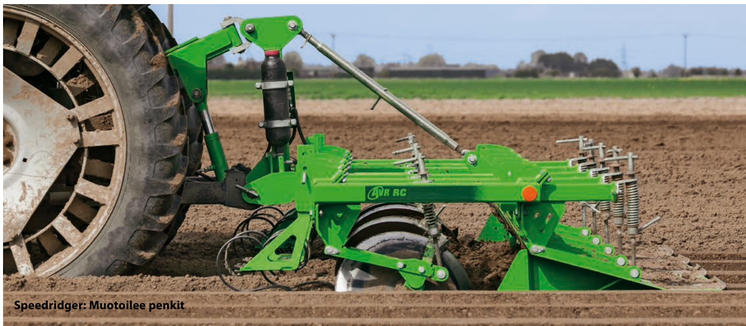
Speedridger: Muotoilee penkit