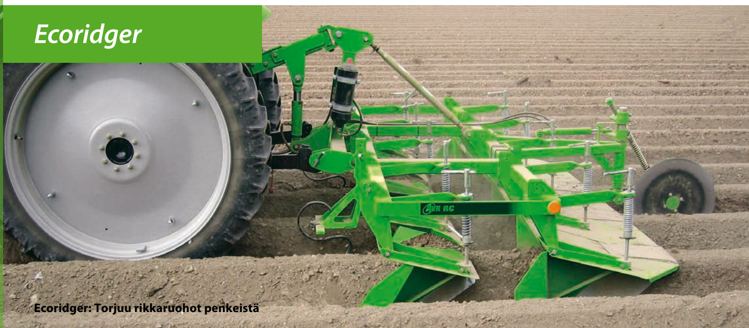
Ecoridger: Torjuu rikkaruohot penkeistä